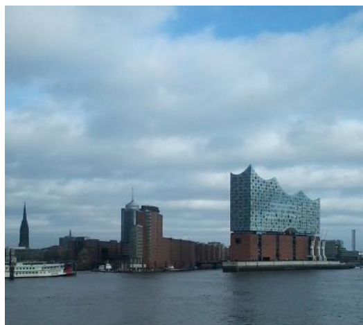
Hamburger Hafen mit Elbphilharmonie

Preise: ab 399,00 € pro Person im Doppelzimmer ab 487,00 € im Einzelzimmer